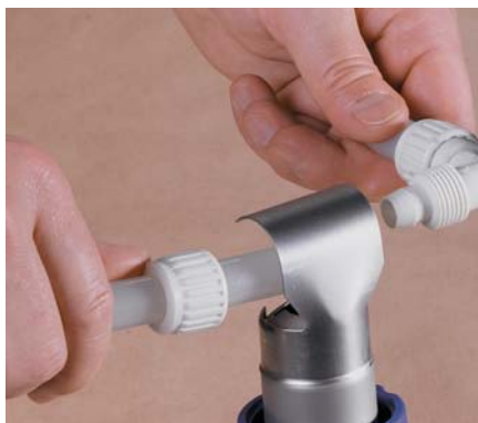
Mettre en forme PIC PRO PLUS