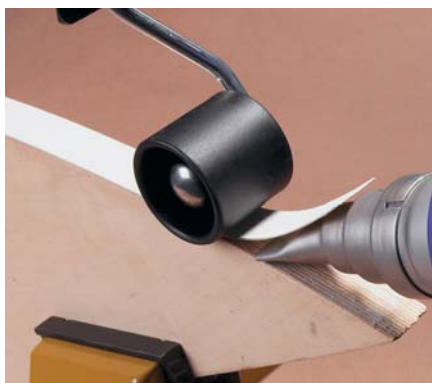
Coller des bords PLUS