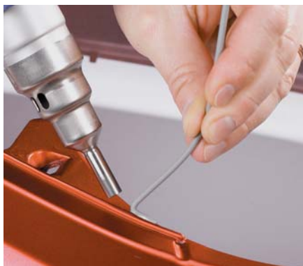
Soudage pendulaire PLUS