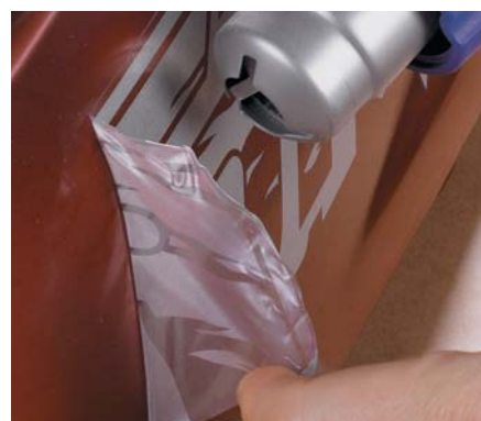
Décoller les autocollants PIC PRO PLUS