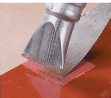
Elimination des peintures PIC PRO PLUS