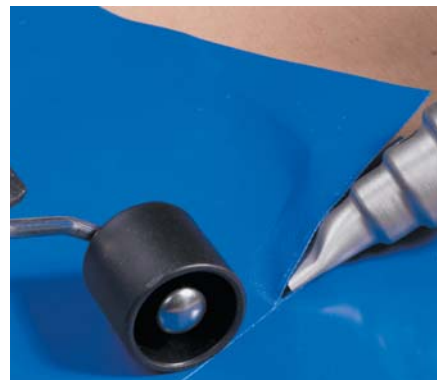
Réparation par soudure PLUS