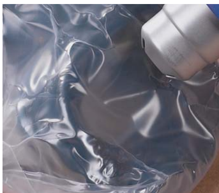
Rétracter PIC PRO PLUS