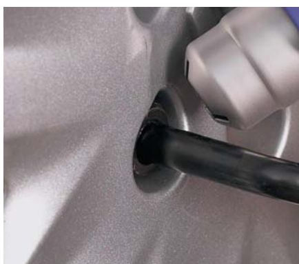
Dilater les écrous PIC PRO PLUS