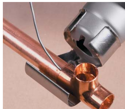
Soudage tendre tubes en cuivre PRO PLUS