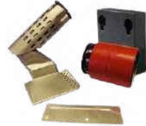
Kit Bitume pour LARON