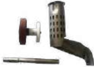
Kit profiles pour LARON