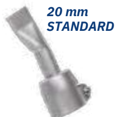
20 mm STANDARD

(et l'ensemble des marques d'appareils du marché)