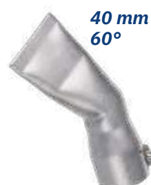
40 mm 60°