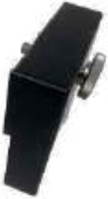
Poids additionnel pour MULTI