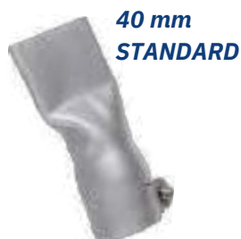
40 mm STANDARD